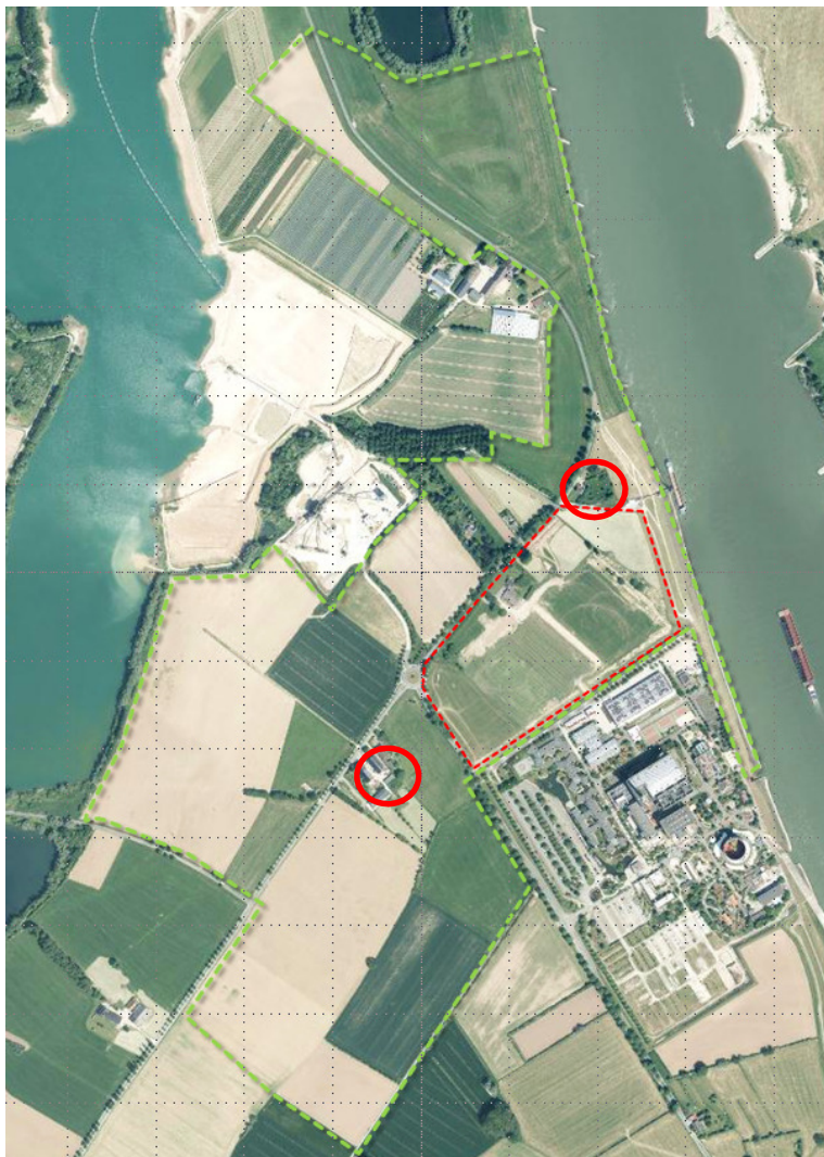
Abb.3: Wirkraum (grün) mit Geltungsbereich des Bebauungsplans bzw. der FNP-Änderung (rot) und Lage der im Jahre 2012 kartierten Steinkauznistplätze (rote Kreise)