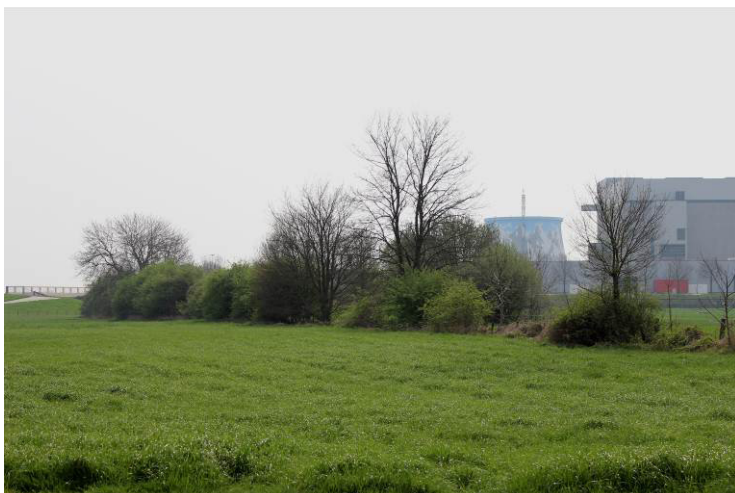
Foto 3: Blick Nordwesten auf die Hecke im nördlichen Teil des Plangebietes