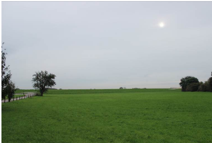
Foto 4: Blick von Südwesten in Richtung Rhein über den nördlichen Teil des Plangebietes