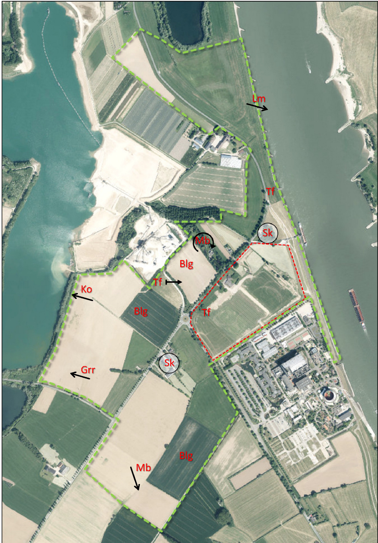
Karte 1: Festgestellte planungsrelevante Arten (alle Ortsbegehungen) (grüne Linie = Wirkraum, rote Linie = Geltungsbereich)