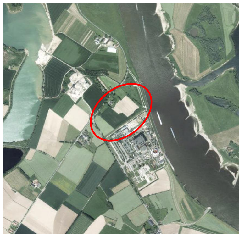
Abb. 2: Luftbild des Plangebietes und seiner Umgebung

Die nähere Umgebung ist insbesondere durch landwirtschaftliche Nutzungen, den Rhein, Abgrabungsgewässer sowie Abgrabungstätigkeit gekennzeichnet. Zudem verläuft entlang der nördlichen Plangebietsgrenze ein permanentes Transportband des Kies- und Betonwerkes, welches tagsüber dauerhaft in Betrieb ist und zu einer erheblichen Lärmvorbelastung der Planfläche führt.