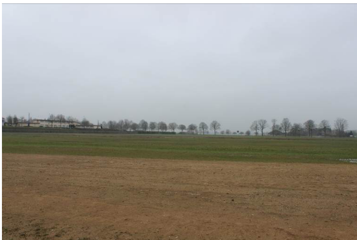
Foto 9: Blick von der Mitte des Plangebietes in Richtung Griether Straße