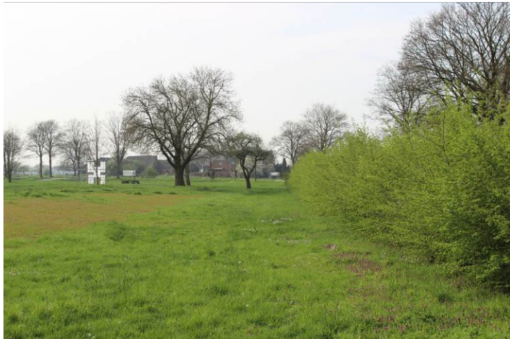
Foto 2: Blick von Nordosten entlang der nördlichen Grenze Richtung Griether Straße