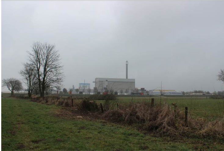
Foto 7: Blick von Nordwesten über die auf Stock gesetzte Hecke im Norden des Plangebietes