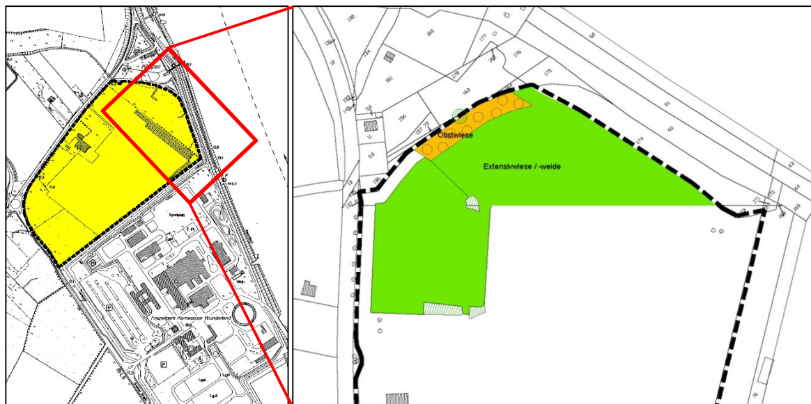
Abb. 3: Lage der CEF-Maßnahmen