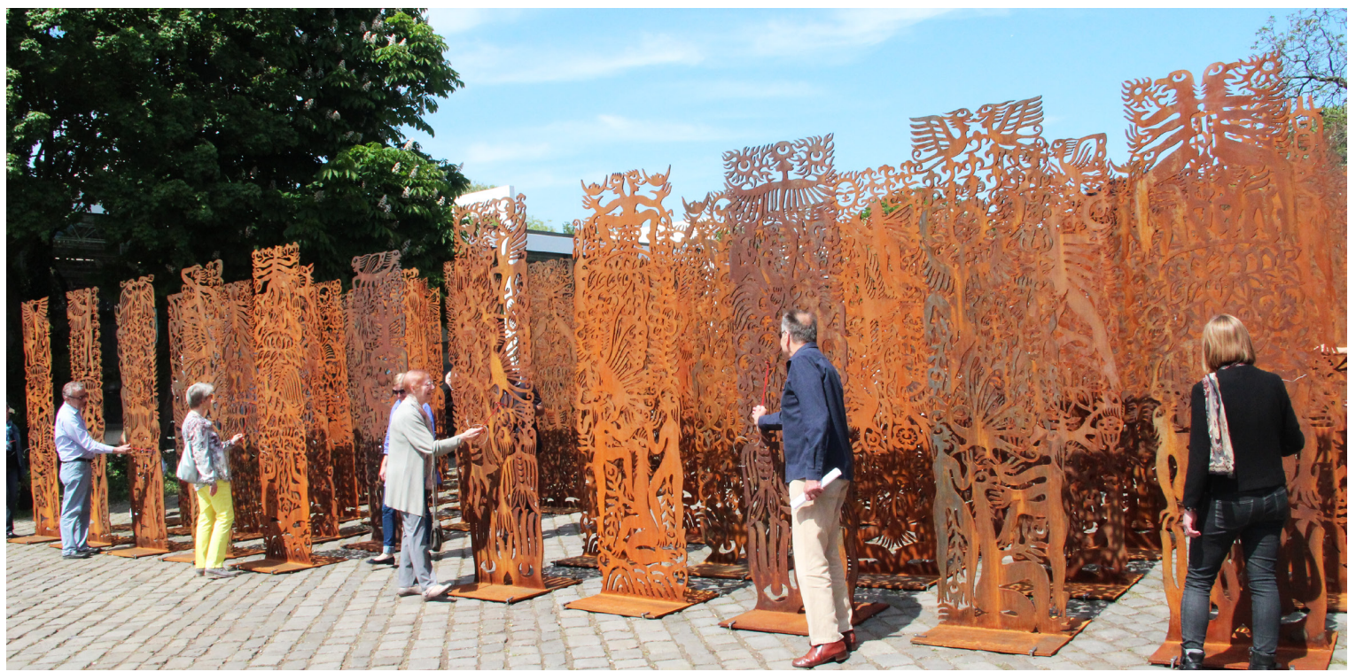
GENESIS | 2015 | 300 cm x 80 cm | Eisen | Installation im Lehmbruck Museum Duisburg

Die Exponate sind in der Galerie Hof-Nr.3, Kunsthalle Kalkar und im Rathaus Kalkar zu sehen.