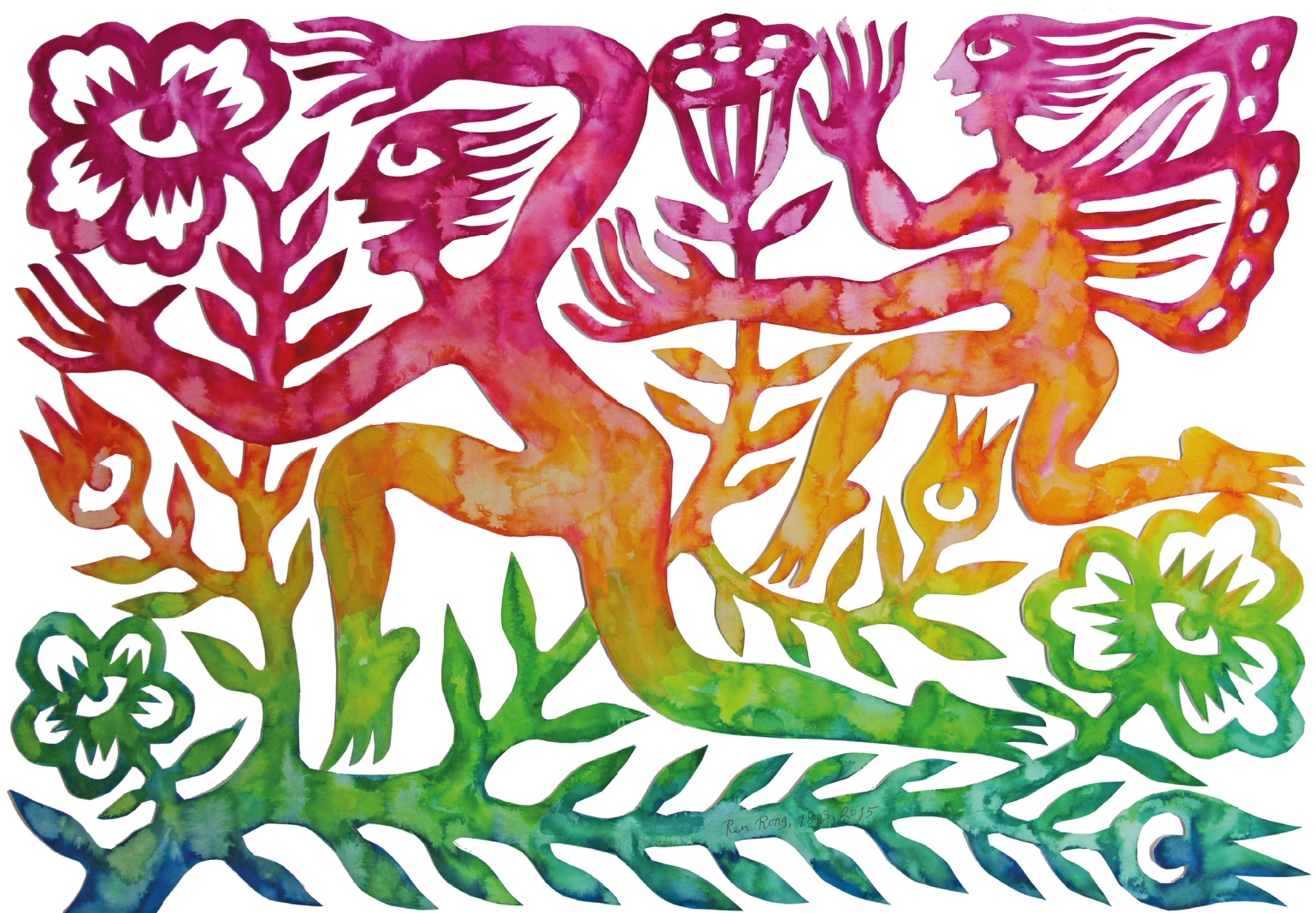
BLUMENGESCHENK 1 | 2015 | 125 x 94 cm | Aquarell & Scherenschnitt in 3D-Technik

Wir freuen uns, Sie und Ihre Freunde herzlich zur offiziellen Eröffnung der Ausstellung