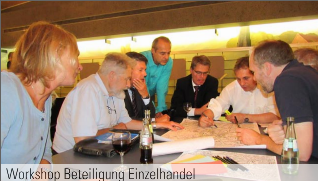
Workshop Beteiligung Einzelhandel

parallel ablaufende Bemusterung verschiedener stadtbildprägender Gebäude