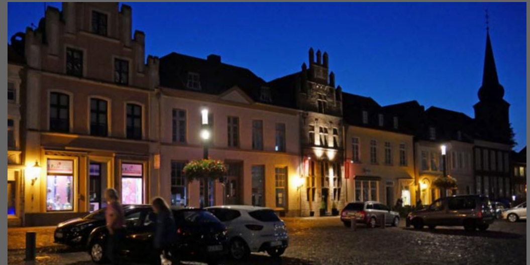
Bestandssituation Schaufenster Marktplatz