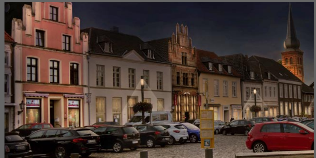
Visualisierung Schaufenster Marktplatz