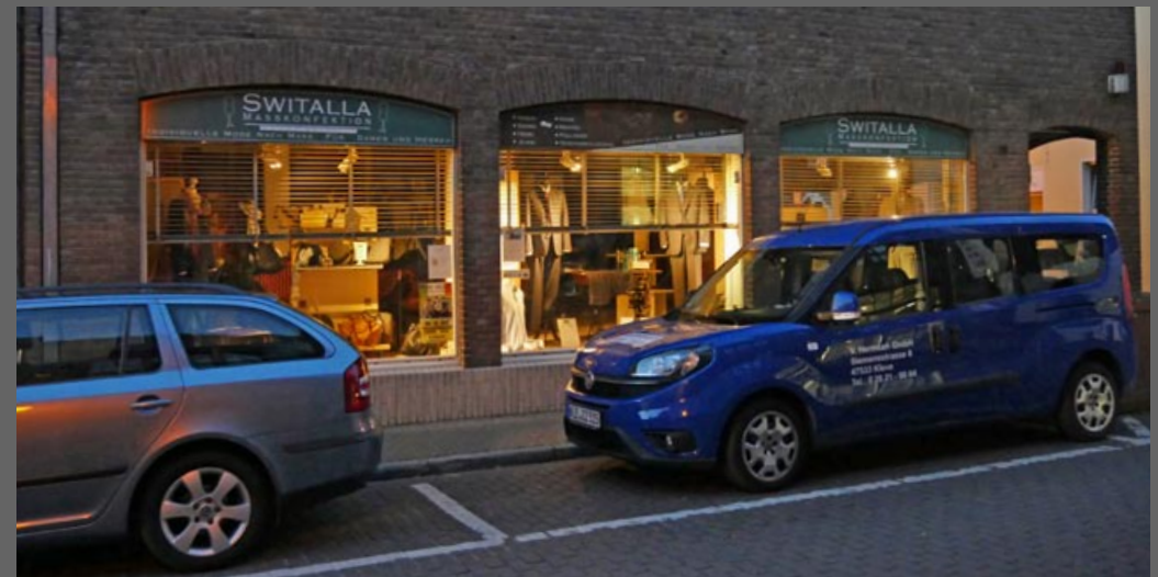
Positivbeispiel Schaufensterbeleuchtung in Kalkar