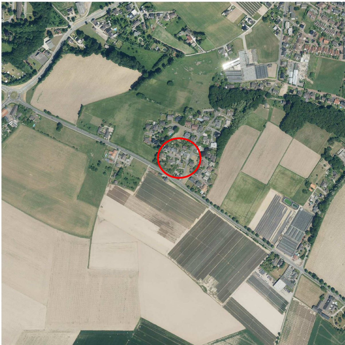
Abbildung: Luftbild des Plangebiets

Die Umgebung des Plangebiets ist hauptsächlich landwirtschaftlich geprägt. Neben Ackerflächen zählen auch Waldflächen des LSG „VO Kleve“ zum Landschaftsbild.