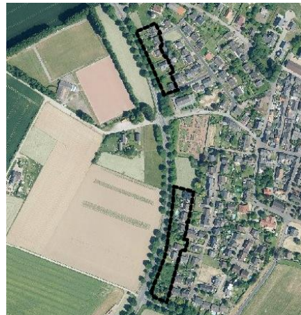
Luftbild des Plangebiets

Im Norden grenzt der südliche Geltungsbereich an den Griether Friedhof, der nördliche an die Griether Mühle. Im Süden bilden südlich die Griether Straße und nördlich die Bürgerhalle Grieth die Grenze, während beide Plangebiete im Westen an die Landesstraße L8 / Rheinuferstraße reichen. Östlich der Plangebiete befindet sich der Dorfkern Grieths. Mit der Änderung werden nur die Grundstücke überplant, die unmittelbar an die Landesstraße grenzen und sich in Privatbesitz ohne öffentliche Funktion befinden.