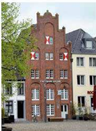
Unser Kundenbüro direkt am Markt