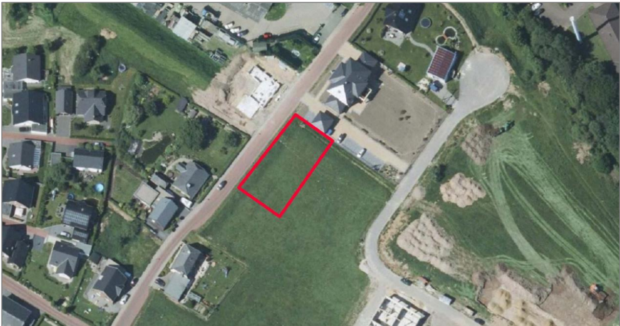
Abbildung 2: Luftbild Stand 2012 (ohne Maßstab)

Auf dem Plangebiet selbst befindet sich eine Wiese. Das Plangebiet besteht aus einem Teil des Flurstücks Gemarkung Altkalkar, Flur 18, Flurstück 62.