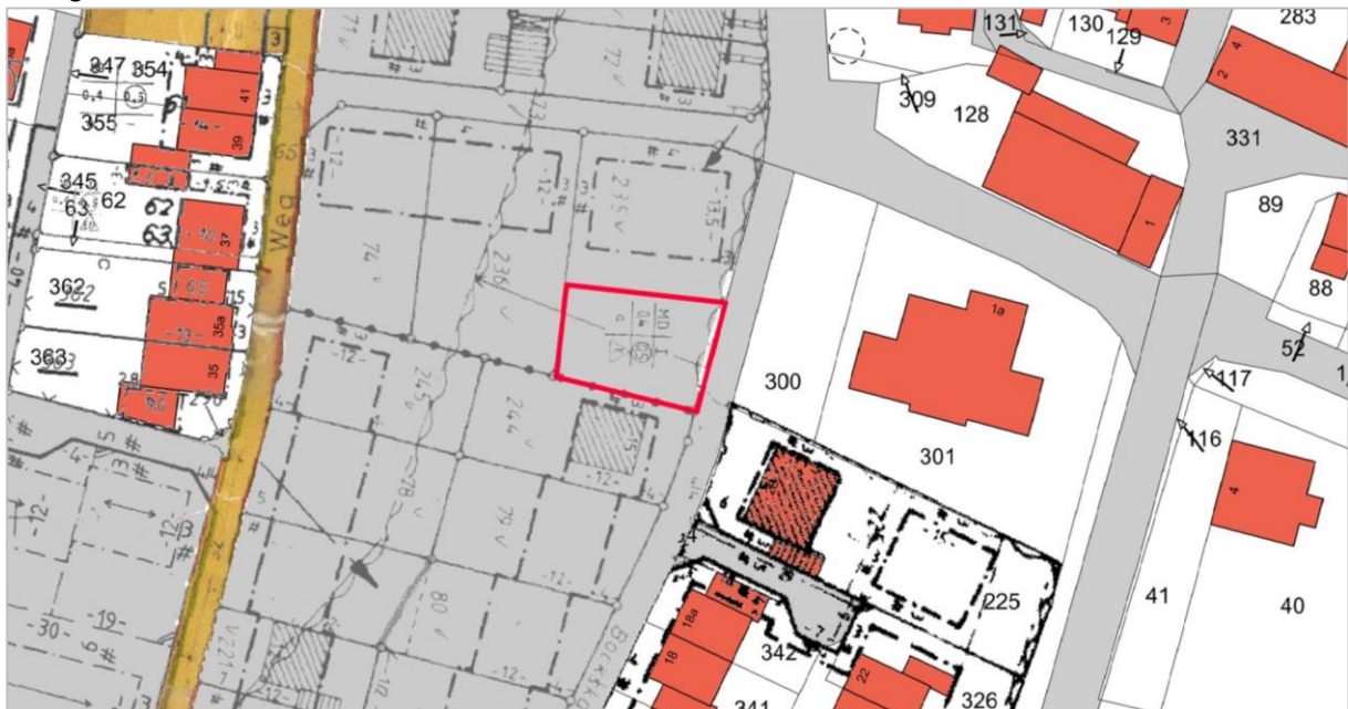
Abbildung 3: Übersicht der geltenden Bebauungspläne (ohne Maßstab)

Das Plangebiet befindet sich innerhalb des rechtsverbindlichen Bebauungsplans Nr. 018 – Grieth West –, der für den Bereich „Dorfgebiet“ festsetzt. Es liegt zudem eine Gestaltungssatzung für das Plangebiet vor. Sonstige baurechtliche Satzungen liegen für das Plangebiet nicht vor.