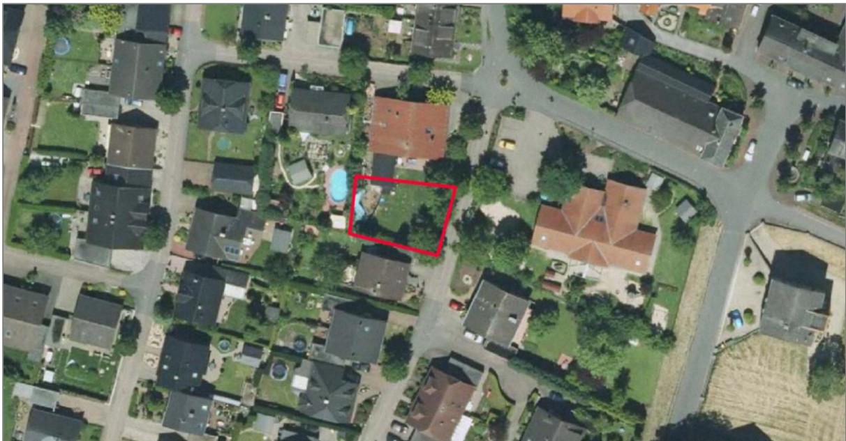
Abbildung 2: Luftbild Stand 2012 (ohne Maßstab)

Das Plangebiet selbst ist gärtnerisch gestaltet. Das Plangebiet besteht aus dem Flurstück Gemarkung Grieth, Flur 4, Flurstück 409.