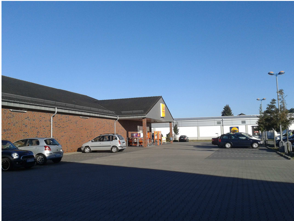
Foto 3: Blick von Südosten auf den Parkplatz und den Netto-Markt

Dieser artenschutzrechtliche Fachbeitrag wurde von den Verfassern nach bestem Wissen und Gewissen unter Verwendung der im Text angegebenen Literatur/Links erstellt.