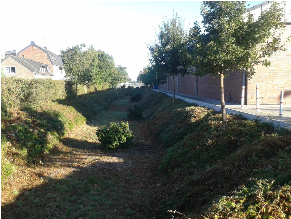
Foto 1: Blick von Süden entlang der Grünfläche an der westlichen Plangebietsgrenze